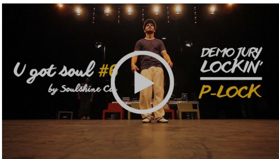
U got soul #6 by Soulshine Cie