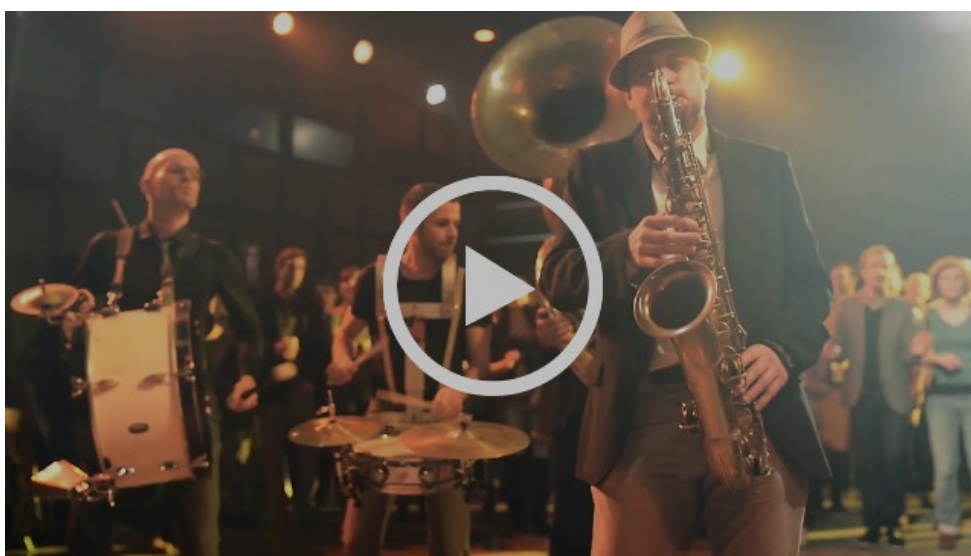
Teaser Soultrain - Le Bal Saint Louis