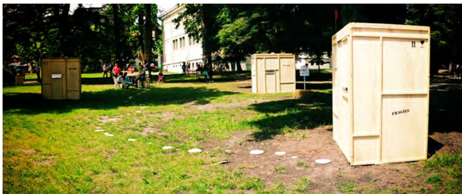
Festival Tous dehors (Enfin !) - La Passerelle - Scène nationale de Gap et des Alpes du sud