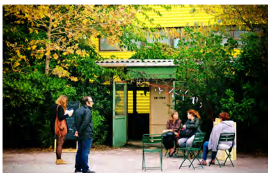
Festival Carrément à l'Ouest Le Citron Jaune - Port-Saint-louis du Rhône

Elles peuvent aussi être posées dans ou devant des médiathèques, des bibliothèques ou dans le cadre d'événements littéraires parce qu' In-Two est un entresort qui fait la part belle aux auteurs et à la littérature.