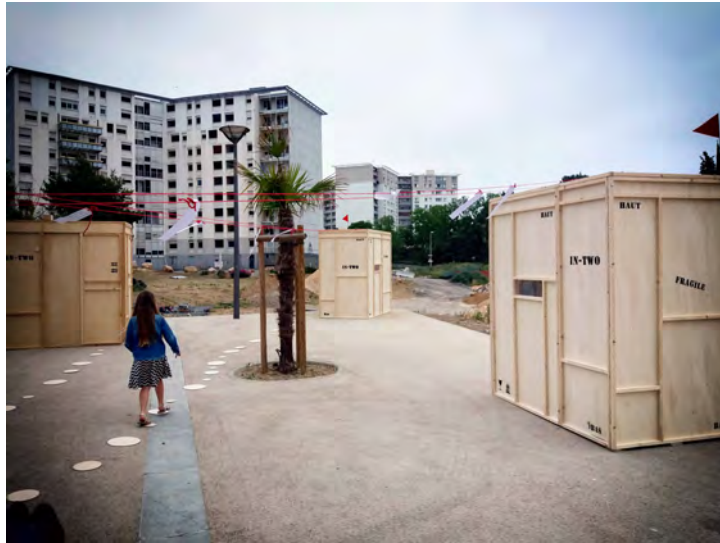
Festival le temps des envolées - Théâtre du Merlan - Scène nationale de Marseille