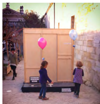
CNES - La Chartreuse de Villeneuve-lez-Avignon